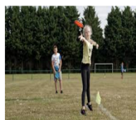
le double disc court