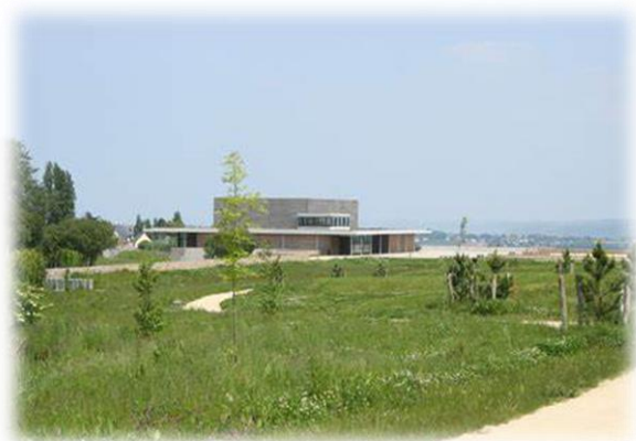
Parc du Grand Pré à Langueux

Nouveau parcours proposé par l'équipe de Saint Pierre Saint-Brieuc. Bilan positif aussi bien de la part des élèves que des enseignants.